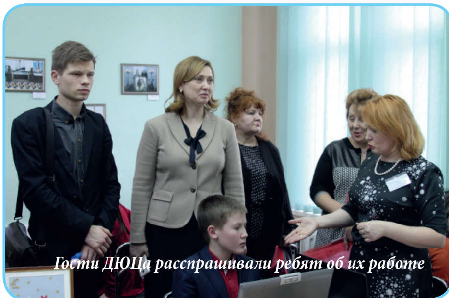
Гости ДЮЦа расспрашивали ребят об их работе