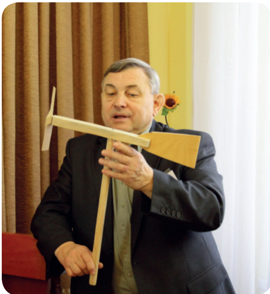
Макеты один в один