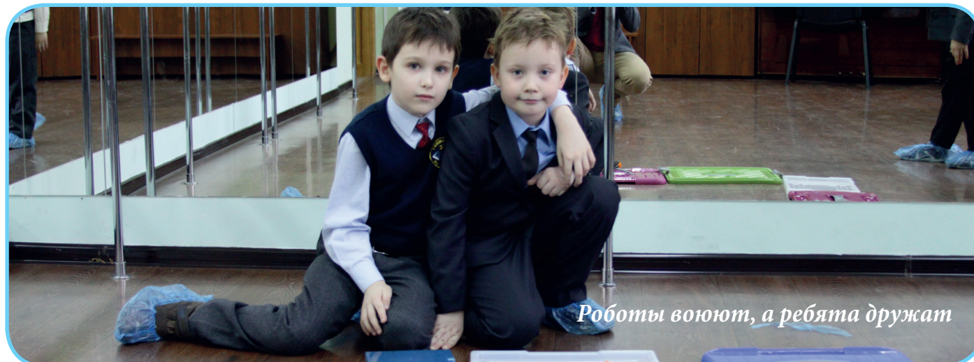
Роботы воюют, а ребята дружат