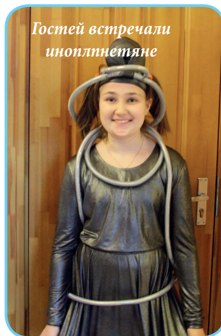
Гостей встречали инопланетяне