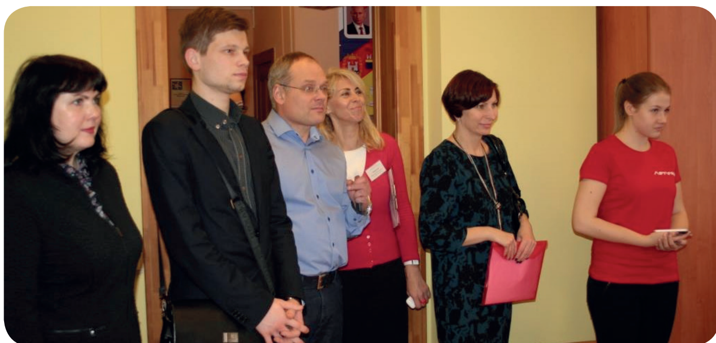
Педагог всегда поможет