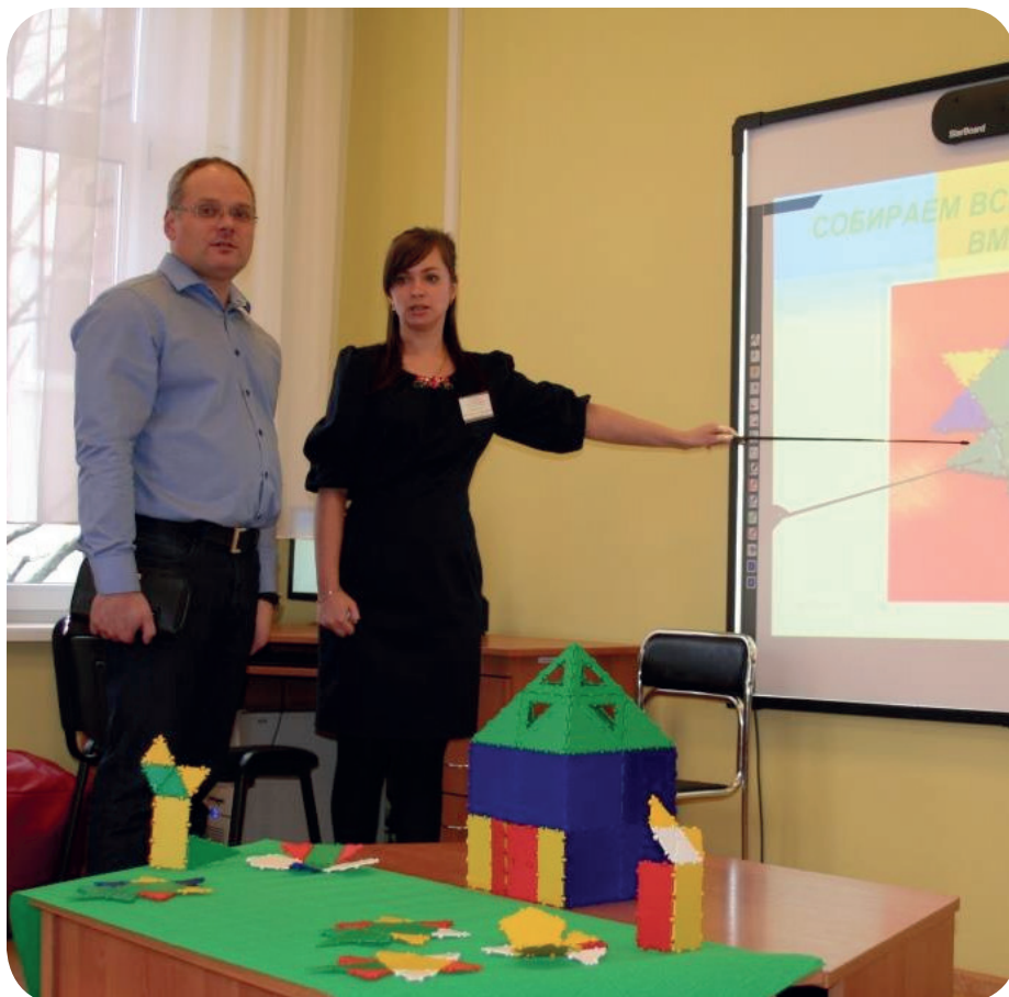
Сделано своими руками

Когда мы начали заниматься, у детей была масса негативных эмоций, потому что не все получалось. Сама по себе шарнирная система для ребят очень сложна, и они не понимали, как нужно сложить детали вместе, чтобы получилась цельная фигура. Но потом, в процессе работы, конечно, при помощи моральной поддержки и похвалы у нас начало получаться. Так что положительные сдвиги в работе, безусловно, имеются.